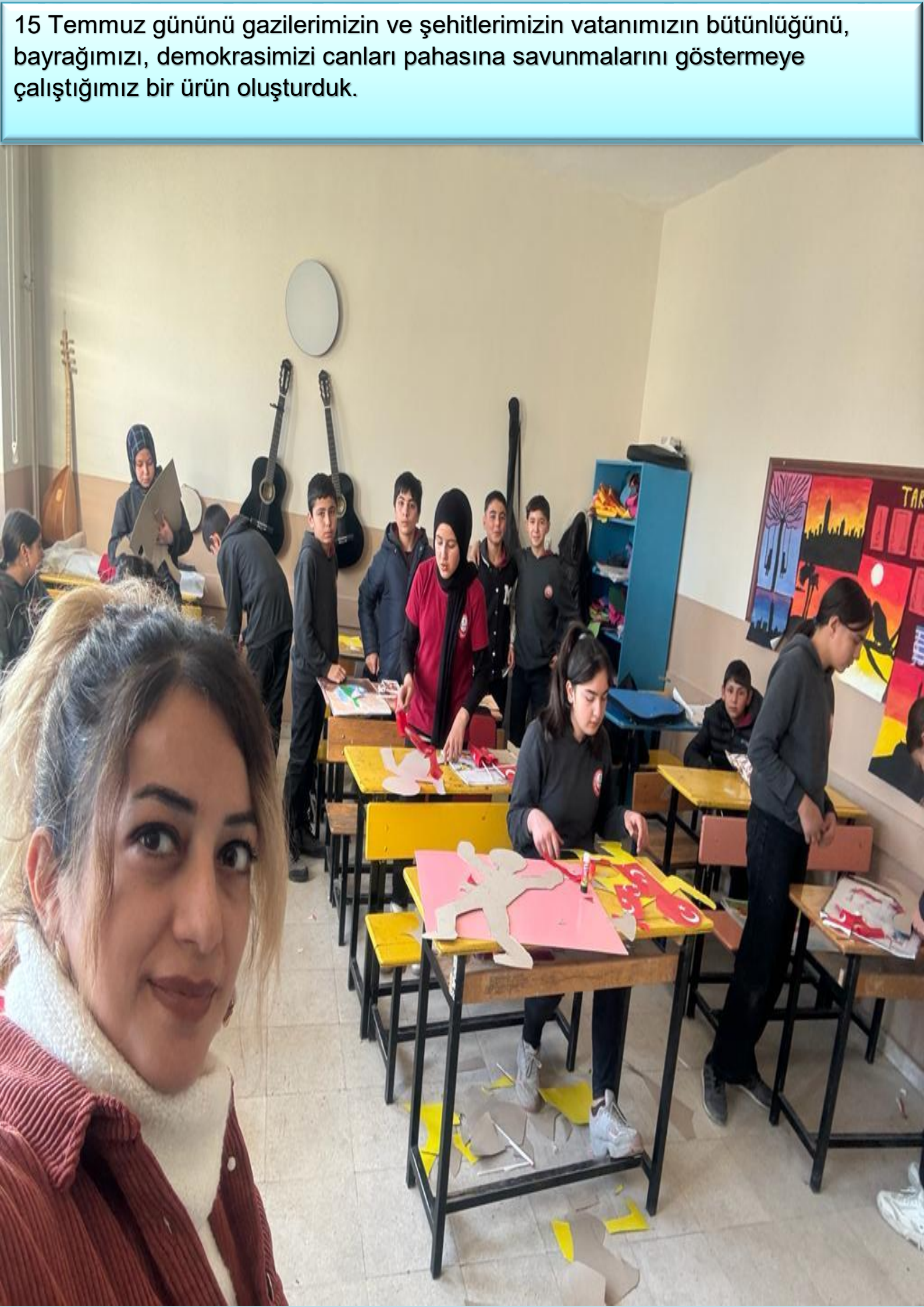
15 Temmuz gününü gazilerimizin ve şehitlerimizin vatanımızın bütünlüğünü, bayrağımızı, demokrasimizi canları pahasına savunmalarını göstermeye çalıştığımız bir ürün oluşturduk.